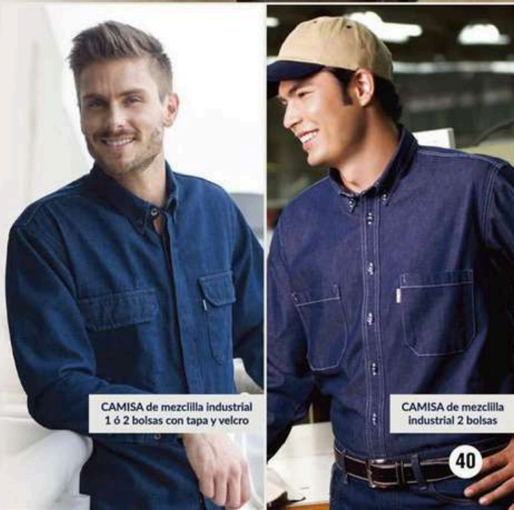
CAMISA de mezclilla industrial 1 ó 2 bolsas con tapa y velcro