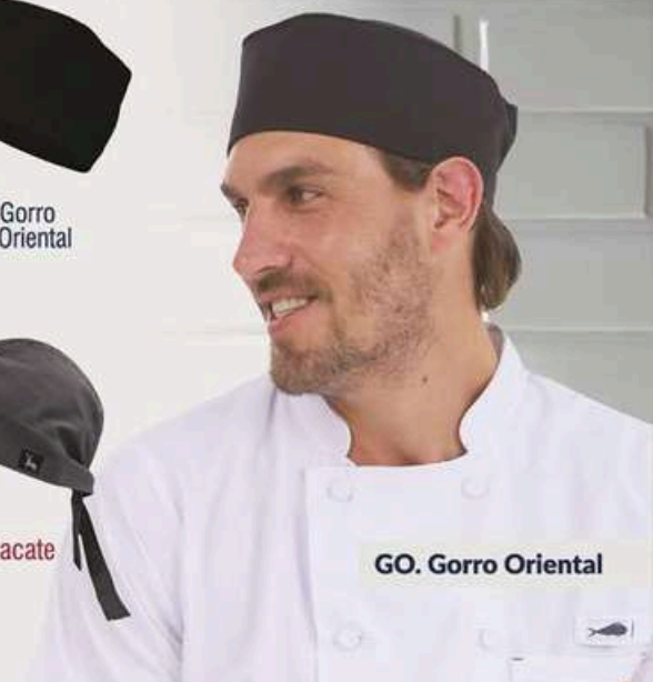
GO. Gorro Oriental