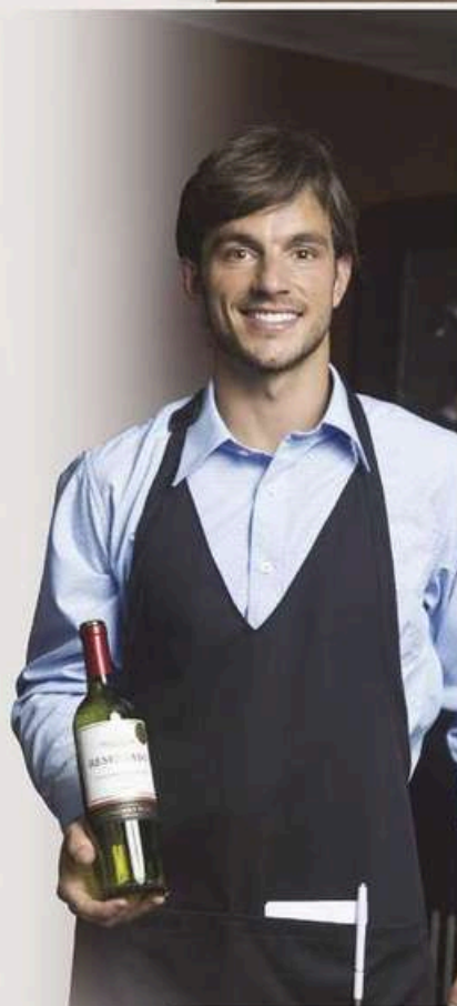
MANDIL mesero cuello v