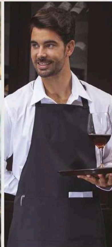
MANDIL de pechera tipo mesero