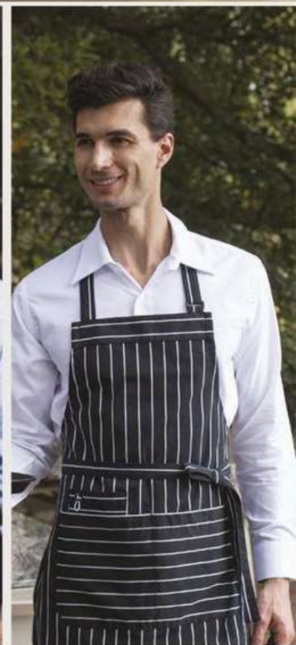
MANDIL mesero rayas