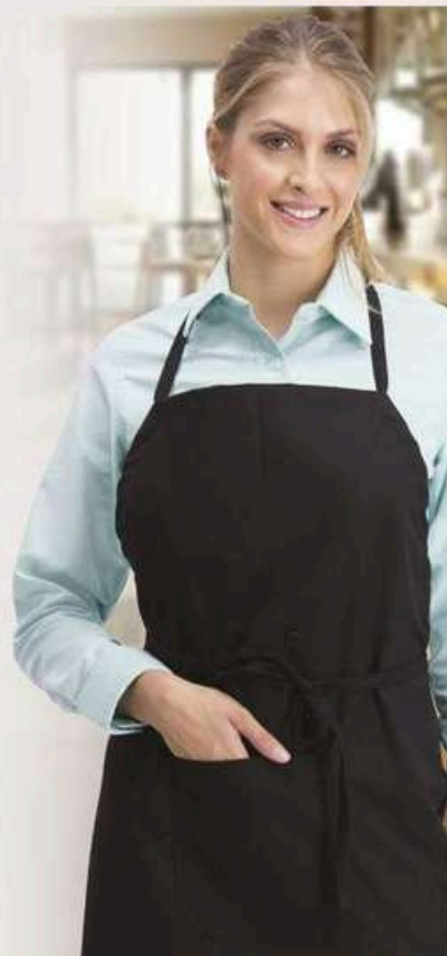
MANDIL de pechera tipo cocinero