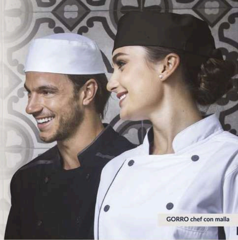
GORRO chef con malla