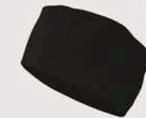
GO. Gorro Chef Oriental